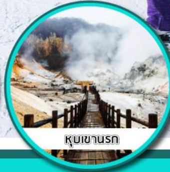
หุบเขานรก