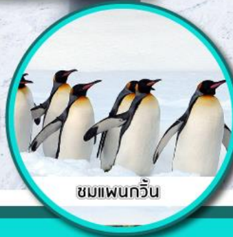
ชมเพนกวิน