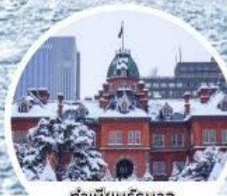
ท่าเมย์บริธุนาส