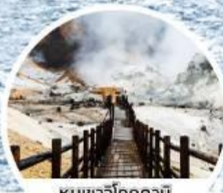
หุบเขารังโคคุดามิ